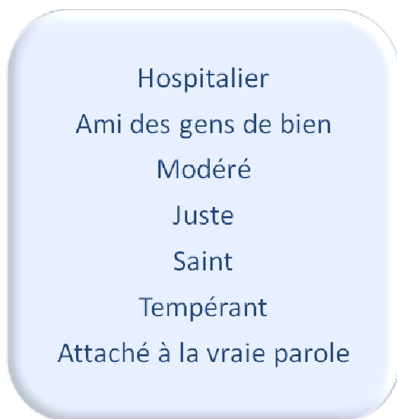
Qualités d'un responsable Tite 1.8-9

Tu as dû trouver ceci, ou des expressions équivalentes :